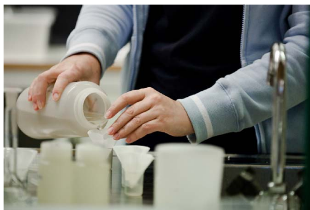
Kvalitetskontroll av massa vid Vallviks Bruk.